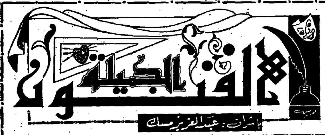
إشراف: عبد العزيز مسك